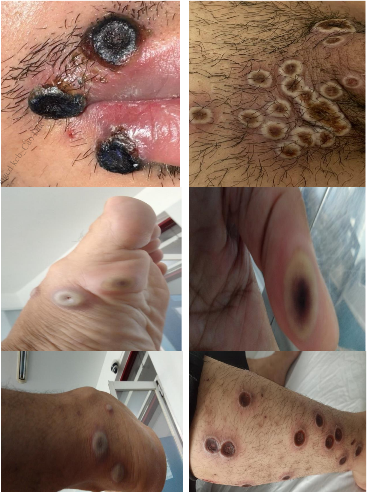
Hình 2. Hình ảnh tổn thương sâu