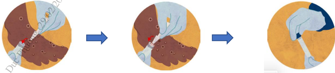
Hình ảnh minh họa về lấy mẫu da/vảy khô từ vết tổn thương

thương): sử dụng panh kẹp hoặc dụng cụ gấp (có đầu không sắc) vô trùng để gấp toàn bộ hay một phần da/vảy khô (kích thước ít nhất 4mmx4mm) rồi cho vào ống vô trùng (ống 1,5ml hoặc ống 5ml) không chứa môi trường vận chuyển. Sử dụng băng cá nhân để băng lại vết thương sau khi lấy mẫu.